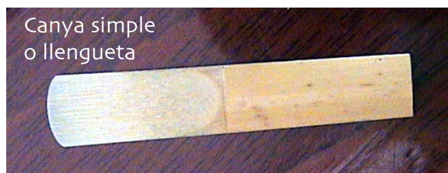
Canya simple o llengueta