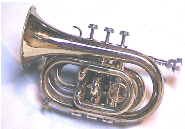
Trompeta de butxaca